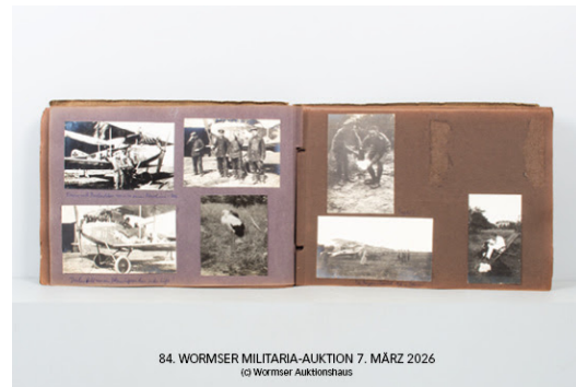
Losnr. 95120 Umfangreicher Nachlass des PLM-Trägers Erwin Böhme Limit: o.L.