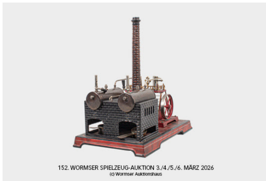
Losnr. 40123 Doll 2-Kessel- Schiffsdampfmaschine, selten Limit: o.L.