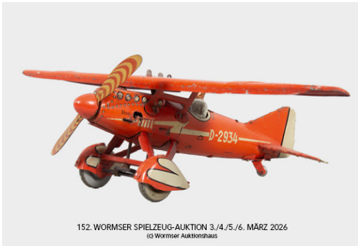
Losnr. 60381 Tippco Sportflieger D-2934, Blech Limit: 400 €